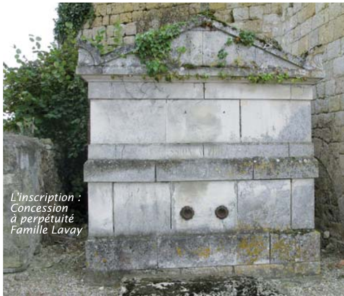
L'inscription : Concession à perpétuité Famille Lavay