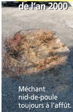
Méchant nid-de-poule toujours à l'affût.