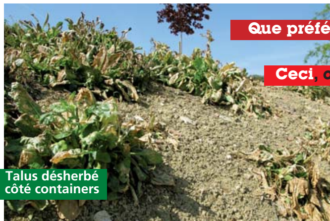
Talus dés herbé côté containers

Dernière minute : une pelleteuse a remodelé le talus. Maintenant, tout changerait-il ? ♦