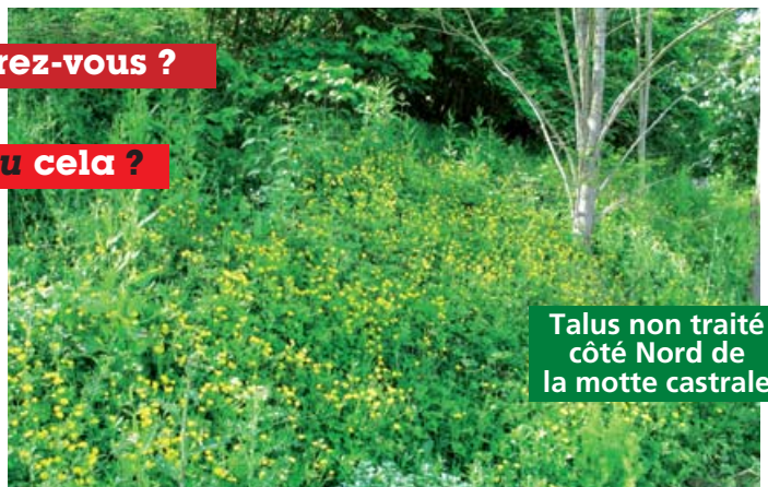
Talus non traité côté Nord de la motte castrale